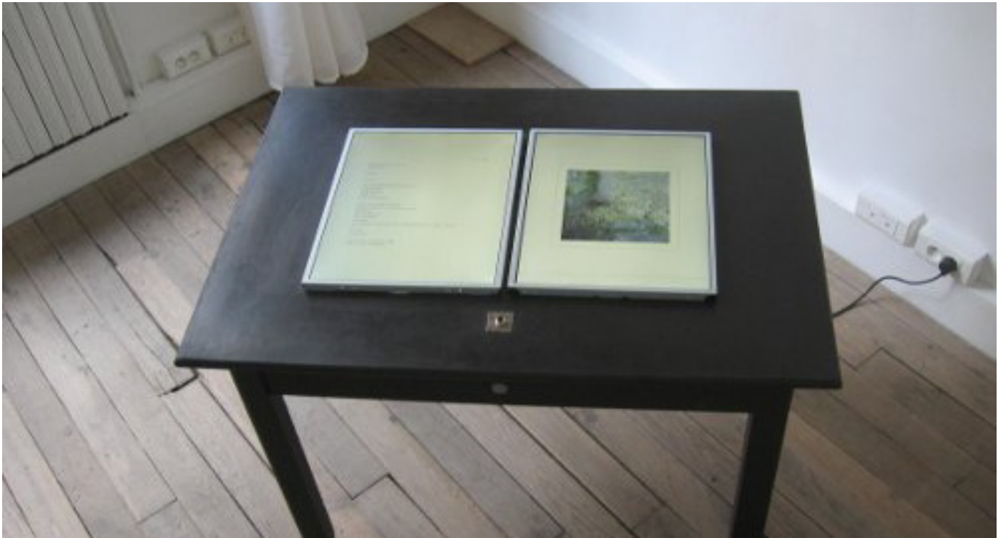
Sans titre à...

Deux écrans sur lesquels s'affichent un montage non linéaire de courtes vidéos, animations, photographies, associées librement à des textes poétiques originaux. Les textes ne sont ni légendes, ni les images des illustrations : la liaison des deux formule un dialogue.