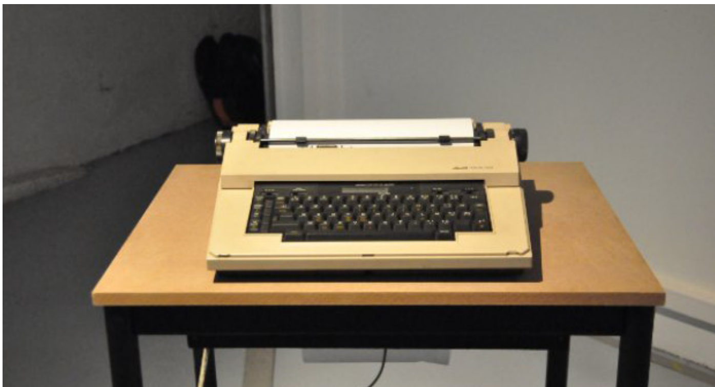
TypeWriterBot ©Gauthier Le Rouzic

Une ancienne machine à écrire, pouvant provoquer et interagir avec le spectateur. Sorte d'intelligence artificielle coincée dans un échantillon de l'histoire des machines communicantes, pour un décalage appuyant l'étrangeté de pouvoir discuter avec une simple machine.