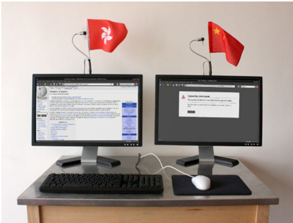
China Channel © A. Bartholl / E. Roth / T. Leingruber

Deux écrans d'ordinateur connectés à internet, l'un présentant notre expérience occidentale du web, l'autre l'expérience que peut en avoir un résident chinois. Le spectateur peut y effectuer ses recherches, découvrant les mécanismes de la censure quotidienne chinoise en comparaison directe à son propre accès.