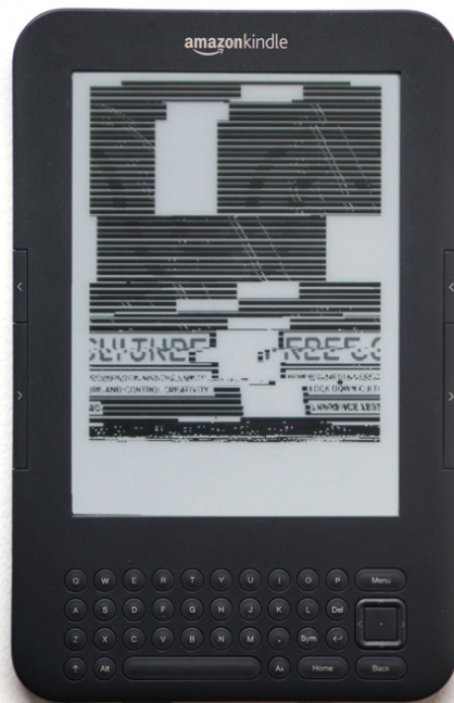
Kindle Glitcher ©Benjamin Gaulon

Une série de fichiers EPUB(format d'édition numérique) corrompus, 'glitchant' (abîmant / créant des bugs) les textes. Le résultat est un nouveau livre, graphique et partiellement lisible, sélections d'erreurs d'un texte passant par l'intermédiaire du code.