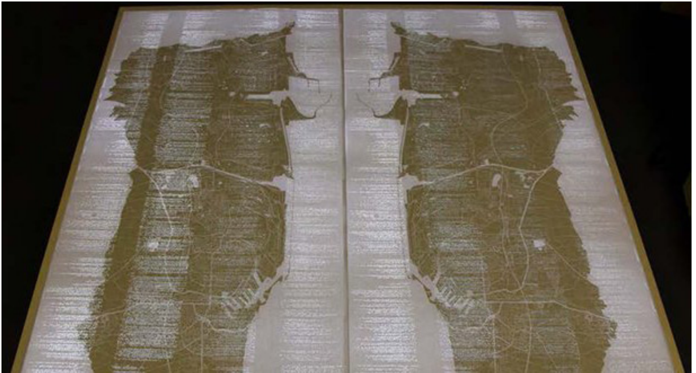
Tonographie rétro-éclairée

Une carte encodée, percée par les témoignages de migrants. La position de chaque percée est définie selon les variations orales de la voix, n'inscrivant ainsi non pas seulement les mots tels un alphabet, mais aussi tout ce que la voix peut amener comme signification, dans le ton ou le rythme.